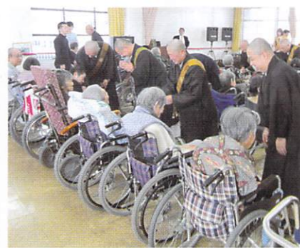
社教会のメンバーとの交流

毎年行われている社教会の施設訪問、今年は小城市の清水園でした。音楽バンドである「小城市ウィンドアンサンブル」の皆様と共に、施設の方々と交流の時間を過ごしました。