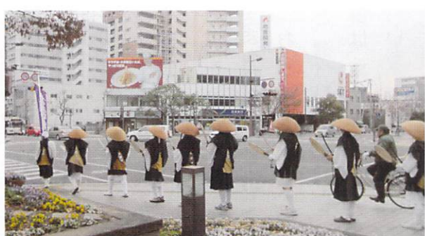
佐賀市内で太鼓を叩く青年僧

歳末助け合い運動の一環として、佐賀市内を青年会の行脚隊が、お題目を唱えながら歩きました。尚、皆様から頂戴した募金は、佐賀新聞社を通じて、寄付させて頂いております。