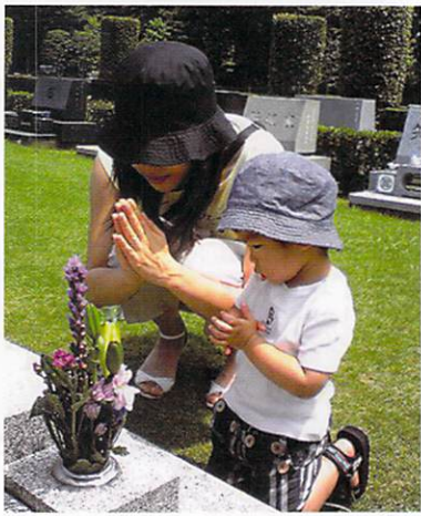
存在を信じ、思い、手を合わせれば、そこに ご先祖さまはあらわれます。

その悟りへの道というのは、布施・持戒・忍辱・精進・禅定・智慧の「六波羅蜜」を實踐することです。布施とは人に施すこと、持戒とは戒律を持って生きること、忍辱とは耐え忍ぶこと、精進とは努力