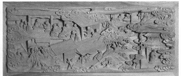
▲立正安国論奏進の図