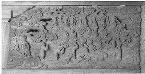
▲妙法蓮華経宝塔品第十一 多宝塔出見の図

を圖案化して、高さ八十二センチ、横百八十七センチ、厚さ二十一センチのケヤキの板に両面彫りにして、六年の歳月をか