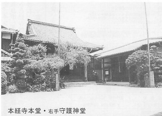
本経寺本堂・右手守護神堂

があります。古来より子育ての神様、鬼子母神様に祈願をなされる方々が、ざくろを捧げてこられました。